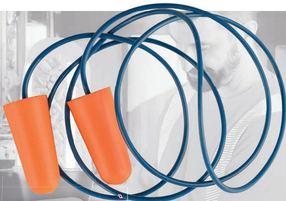
omyvatelné PVC lanko spojující chrániče