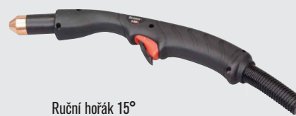
Ruční hořák 15°