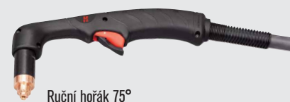
Ruční hořák 75°

(více volitelných možností hořáku viz www.hypertherm.com )